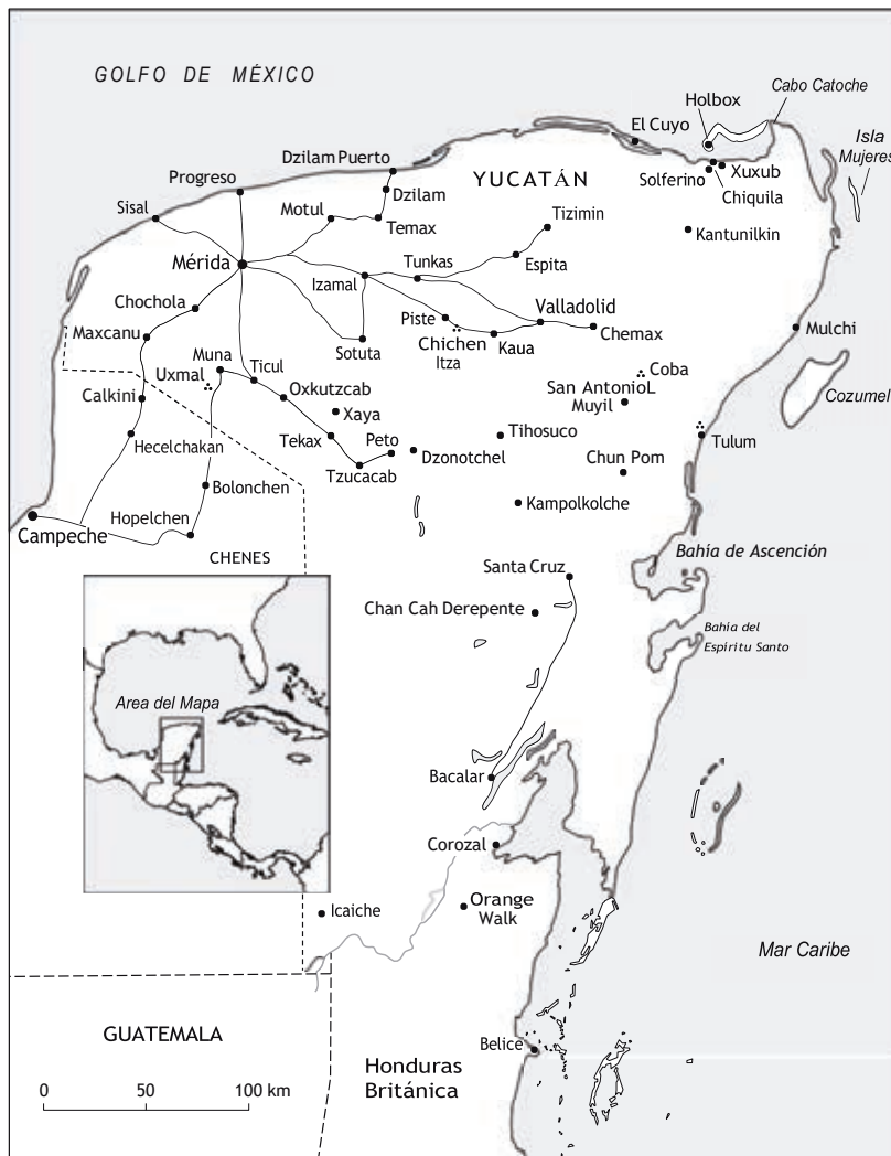
La Península de Yucatán

Para cuando Lespinasse asumió su puesto, las cosas iban cada vez mejor. El estado disfrutaba de un raro período de prosperidad gracias a la creciente demanda extranjera de su principal exportación, la fibra del henequén utilizada para hacer cuerdas y cordeles. Algunos yucatecos se apresuraron a convertir